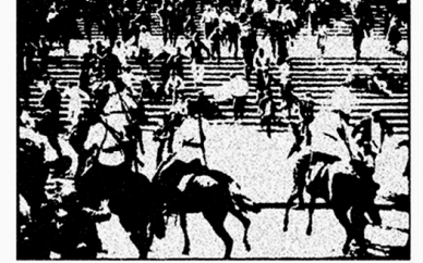
Stanovnici Egipta prosvjeduju i zbog nedostojnih životnih uvjeta, nedostatka prikladnih domova i nemogućnosti da prehrane svoje obitelji.

U tom je smislu posve razumljivo da Martinis, po vlastitom priznanju, 'Egipatske stube Odeše' doživljava jednim od svojih najboljih radova, a činjenicu da se njegova premijera dogodila upravo na Žitnjaku doživljavamo kao dodatno priznanje. (op. u.)